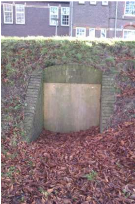
Een van de bunkers op het LIMOS-terrein in Nijmegen, zoals ze in oude situatie waren

Zevenaar: De verwachting dat een kelder na restauratie van het betreffende gebouw beschikbaar zou komen voor vlemuizen is niet uitgekomen door wijziging van de plannen.