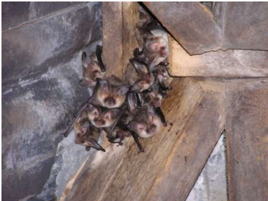
Grootoorvleermuizen op een zolder

In 2014 zijn er op de zolders 3 soorten waargenomen en mest van een 4 e soort (baardvleermuizen). Dit laatste op de zolder van het landhuis op landgoed Halsaf, waar al jaren een kolonie baardvleermuizen aanwezig is. Op vier locaties zijn enkele dwergvleermuizen aangetroffen. In totaal gaat het om 8 dieren. Helaas is dit op 2 locaties alleen maar vastgesteld door het vinden van enkele dode dieren. Naast deze vier locaties wordt er op veel zolders wel mest van dwergvleermuizen gevonden. De meest gevonden soort is uiteraard ook dit jaar weer de gewone grootoorvleermuis. In totaal zijn er 110 grootoren geteld in 2014. Groepen van 5 of meer dieren zijn op 8 locaties gevonden. Dat we eigenlijk niet alleen naar kerkzolders moeten kijken blijkt uit de tellingen op de Veluwe. Daar worden op twee zolders van schoolgebouwen ook grootoren gevonden. De laatste soort is de laatvlieger, daarvan is dit jaar 1 locatie geteld. Hier waren 38 dieren aanwezig.