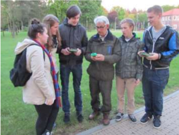
Excursie vleermuisproject College Groevenbeek te Ermelo