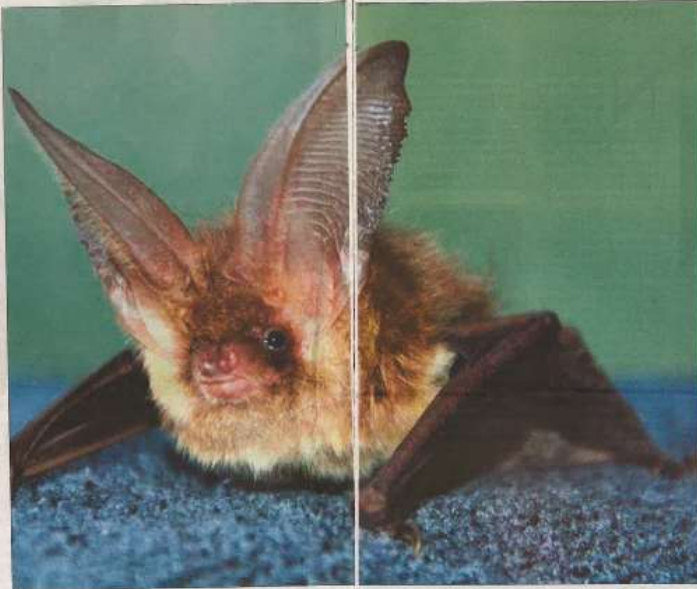
De Grootste vleermuis