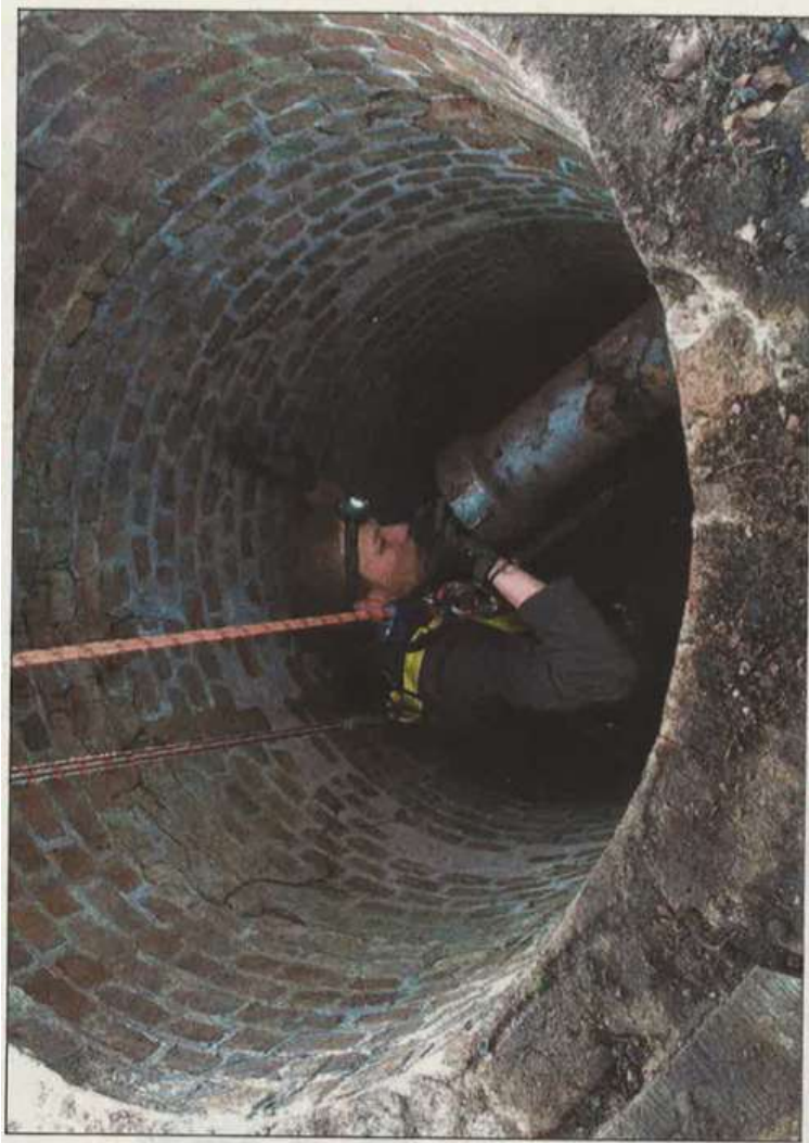
■ Een vrijwilliger daalt af in een waterput in Ugchelen om vleermuizen te tellen.