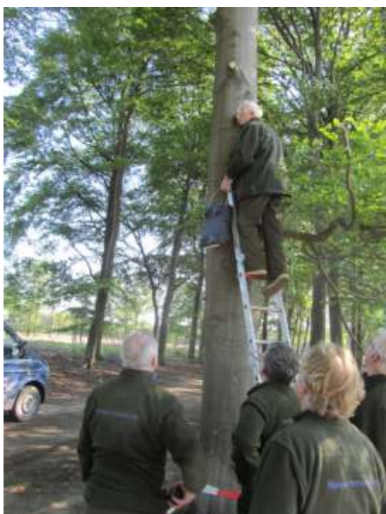
Het ophangen van vleermuiskasten

In 2014 waren de volgende projecten bekend waar grotere aantallen vleermuiskasten zijn geplaatst. In alle gevallen worden de kasten geteld door leden van VleGel. Een kast wordt als gebruikt genoteerd als er vleermuizen of mest in is aangetroffen.