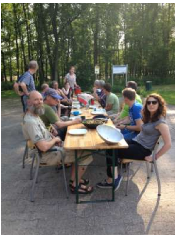
Het gezamenlijke eten op zaterdagavond, met geweldig weer

Met een groep van bekenden en nieuwe leden hebben we natuurgebied Wolfheze in de nachtelijke uren bezocht. Ondanks een warme eerste nacht werden er weinig vleermuizen gehoord en gevangen. Bij terugkomst in de werkschuur op Planken Wambuis zocht een groot deel zijn/haar bijbehorende slaapzak op. Een paar enthousiastelingen hebben in de ochtend nog een aantal zwermende vleermuizen gespot op het terrein van Pro Persona. Na een goed verzorgde maaltijd klaargemaakt door de buurman gingen we met goede moed weer op pad. Dit keer kwamen we terug met een beter resultaat. Zowel op Reijerscamp als Wolfheze werden in totaal 5 soorten vleermuizen gevangen. Ondanks geen hoge aantallen getelde vleermuizen was het een geslaagd weekend!