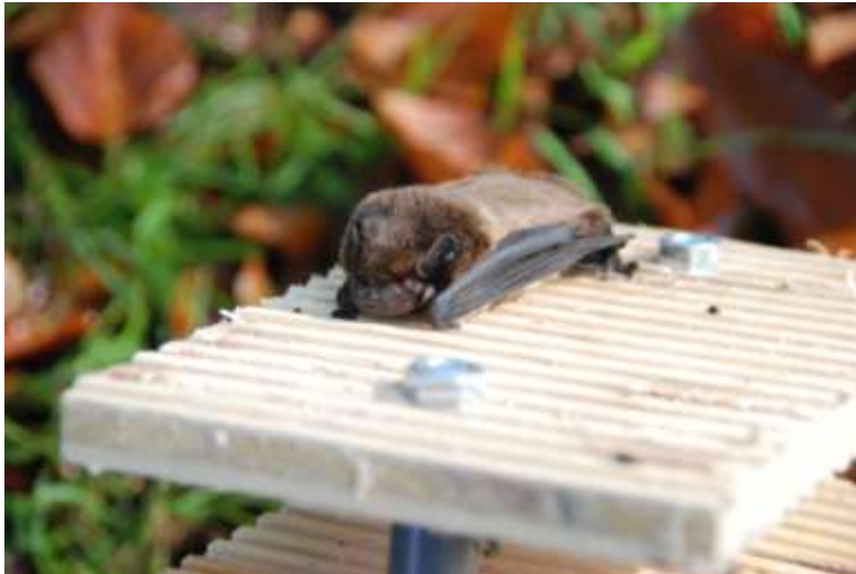
Bosvleermuis uit vleermuiskast van de Oase

De kast wordt 1x per jaar, eind mei begin juni, gecontroleerd. In mei waren er dit jaar een aantal koude nachten, waarna alle dieren verdwenen waren.